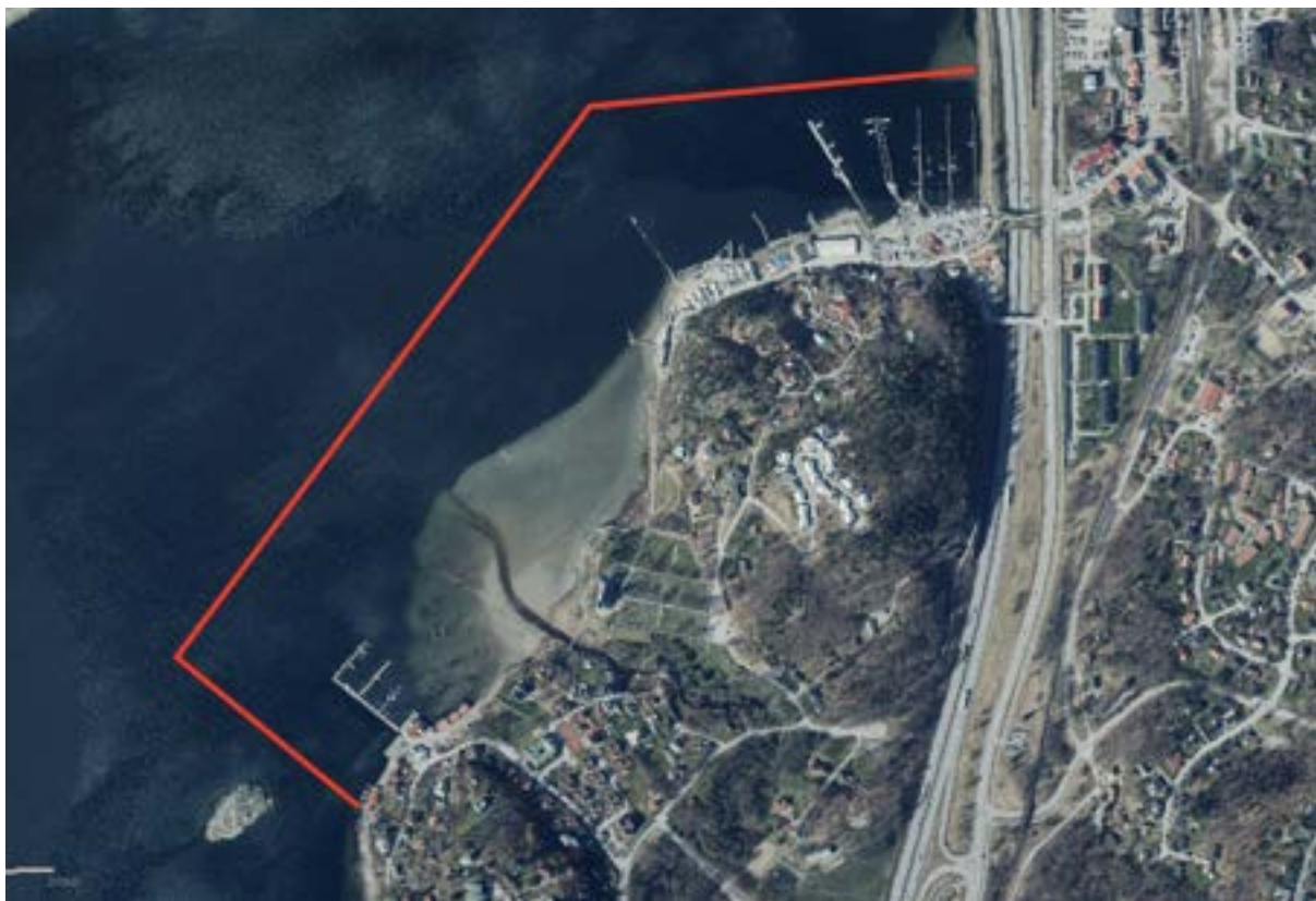
Gästhamnen Källviken (Skafföbron), Uddevalla